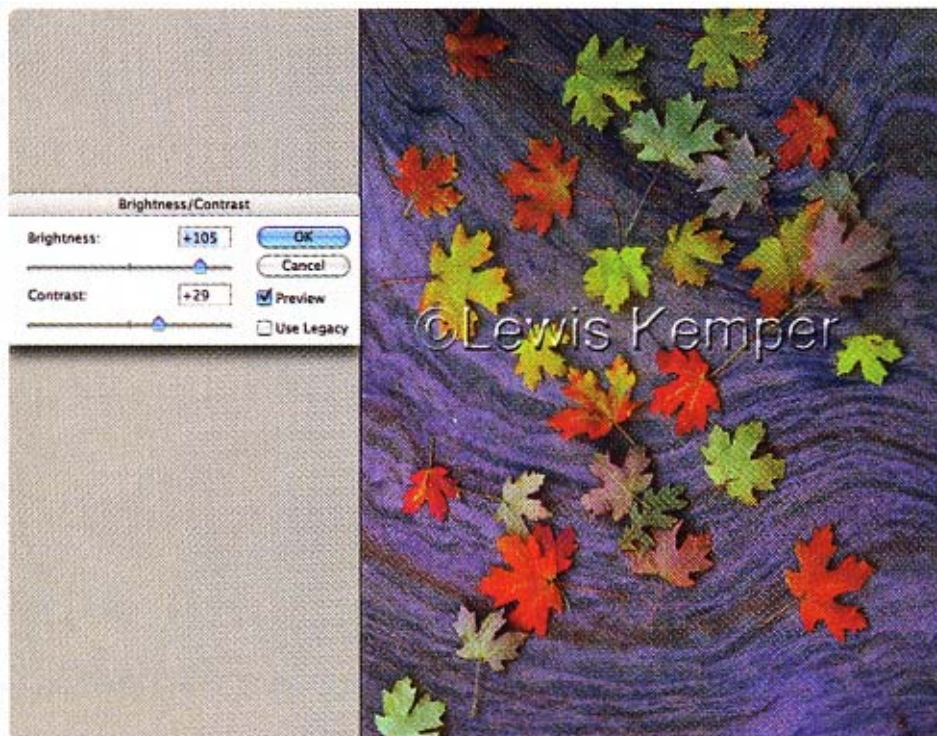
Brightness - Contrast

Trong những thảo trình Photoshop trước đây, Brightness/Contrast là một công cụ “dễ sợ”. Bạn đã có thể dễ dàng chỉnh sai những vùng tối và vùng sáng khi gạt cần slider, và nhiều người mới bắt đầu xử dụng Photoshop đã vô ý làm hỏng ảnh của mình. Tuy nhiên, với Brightness/Contrast mới của CS3 thì bạn không phải lo làm hỏng chất lượng ảnh nữa. Brightness/Contrast đã trở thành một công cụ an toàn và dễ xử dụng cho bất kỳ ai.